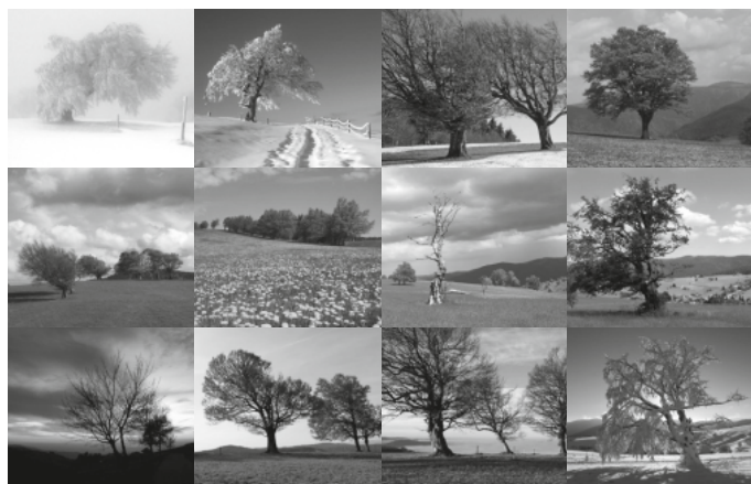
WETTERBUCHEN AM SCHAUINSLAND

Ich schicke den Kalender auch gerne mit der Post!