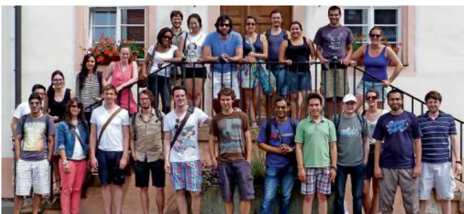
27 Studenten aus 19 Ländern werden in diesem Sommer für ein Nachhaltigkeitskonzept für Oberried forschen

In den Sommermonaten werden nun die Studenten durch Umfragen bei den Haushalten entsprechende Daten erheben, um ein Nachhaltigkeitskonzept zu erstellen. Eine genaue Information dazu erscheint rechtzeitig im Amtsblatt. Wer sich weiter informieren will, kann dies unter http://www.cogreen.de/ tun.