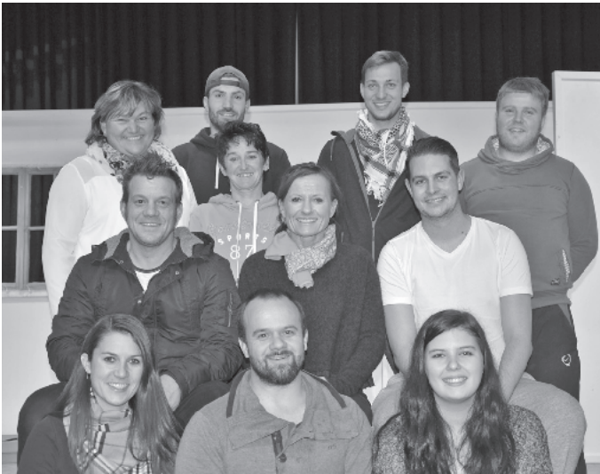
Unser Bild zeigt die Laienspielgruppe der Sportfreunde Oberried

Traditionell am ersten Dezemberwochenende beschert die Laienspielgruppe der Sportfreunde Oberried ihren Gästen einen vergnüglichen Abend. Seit Wochen ist die Theatergruppe für ihren alljährlichen Theaterabend engagiert beim Proben und freut sich nun, die Theaterbesucher mit einer Komödie von Bernd Gombold unterhalten zu dürfen.