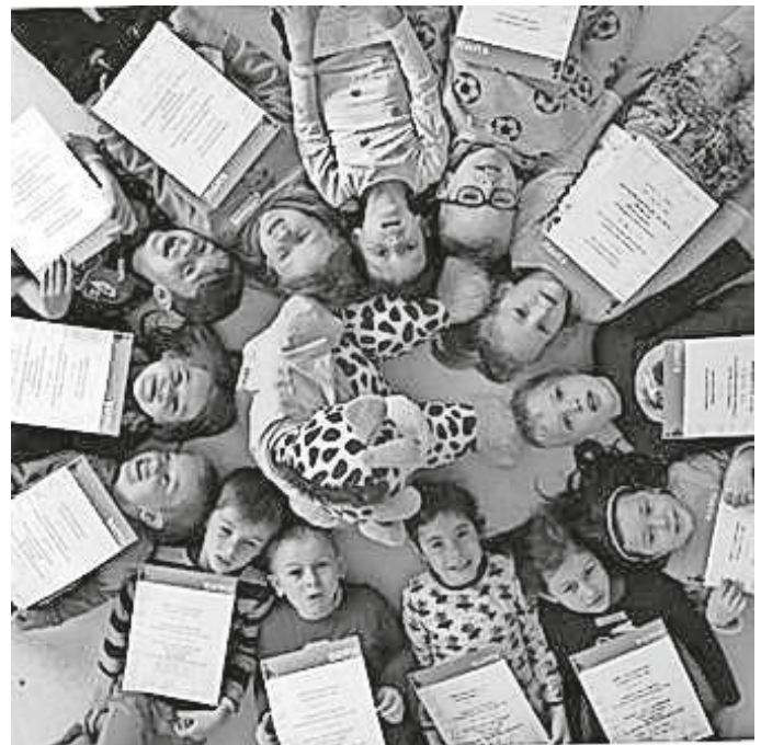
Foto der Schulanfänger mit ihren Urkunden

Auch in diesem Jahr war das Projekt nur durch die finanzielle Unterstützung des Lionsclub Alt Freiburg möglich, welcher wie auch in den Vorjahren die Kosten dafür übernommen hat.