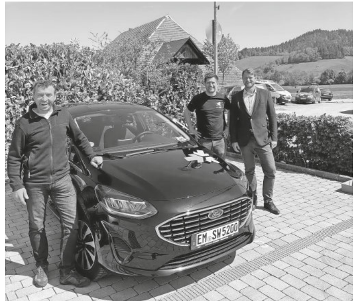
Probierts aus - fährt los - erzähls weiter!

Ab sofort steht auf dem Parkplatz der Wohnbaugenossenschaft, in der Heimat 2 ein Carsharing Auto der grünen Flotte zum Ausleihen zur Verfügung. Die Buchung und Öffnung des Autos erfolgt über die App der grünen Flotte. Vorab muss eine Registrierung bei der grünen Flotte erfolgen, dies dauert nur wenige Minuten und kostet mit dem Gutscheincode GF_START_FR_25 einmalig nur 5 €. Es entstehen keine weiteren laufenden Kosten, man bezahlt nur wenn man fährt. Das Auto wird für ein Jahr in Oberried bleiben und zur dauerhaften Einrichtung werden, wenn es rege genutzt wird.